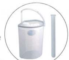
尿タンク・ブラシ 入れが付属します。