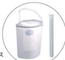
尿タンク・ブラシ 入れが付属します。